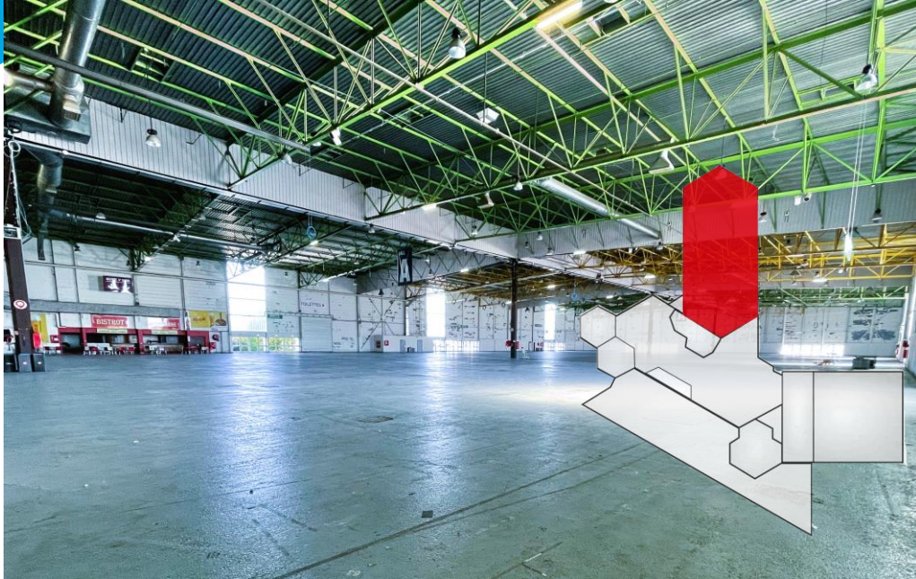
Photographie du Hall A, en rouge sur le plan d'ensemble.