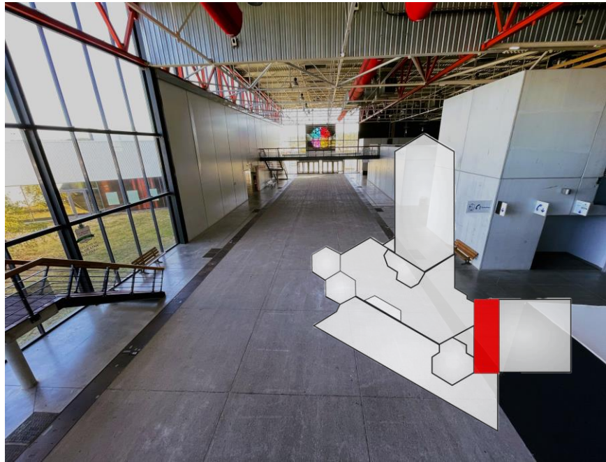
Photographie de la Galerie d'entrée, en rouge sur le plan d'ensemble.